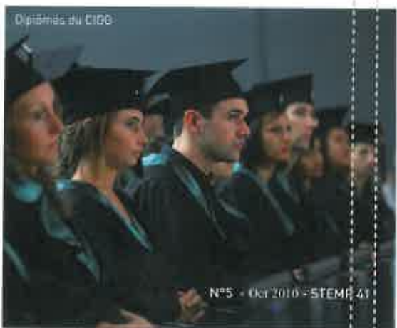
Diplômés du CIDO