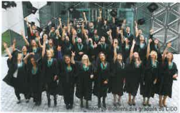
Plus de 45 milliers des diplômés du CIDO