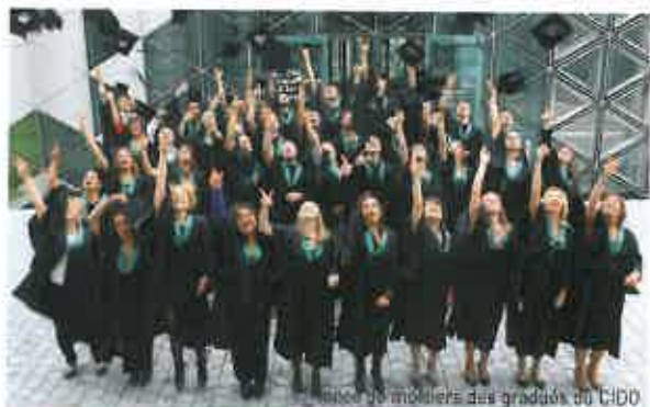
Plus de 45 mortiers des diplômés du CIDO