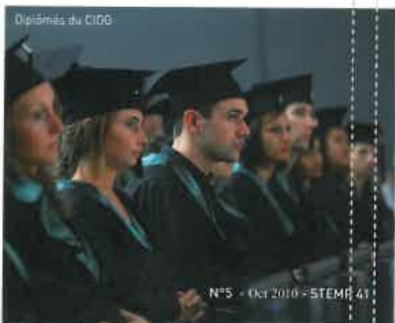
Diplômés du CIDO